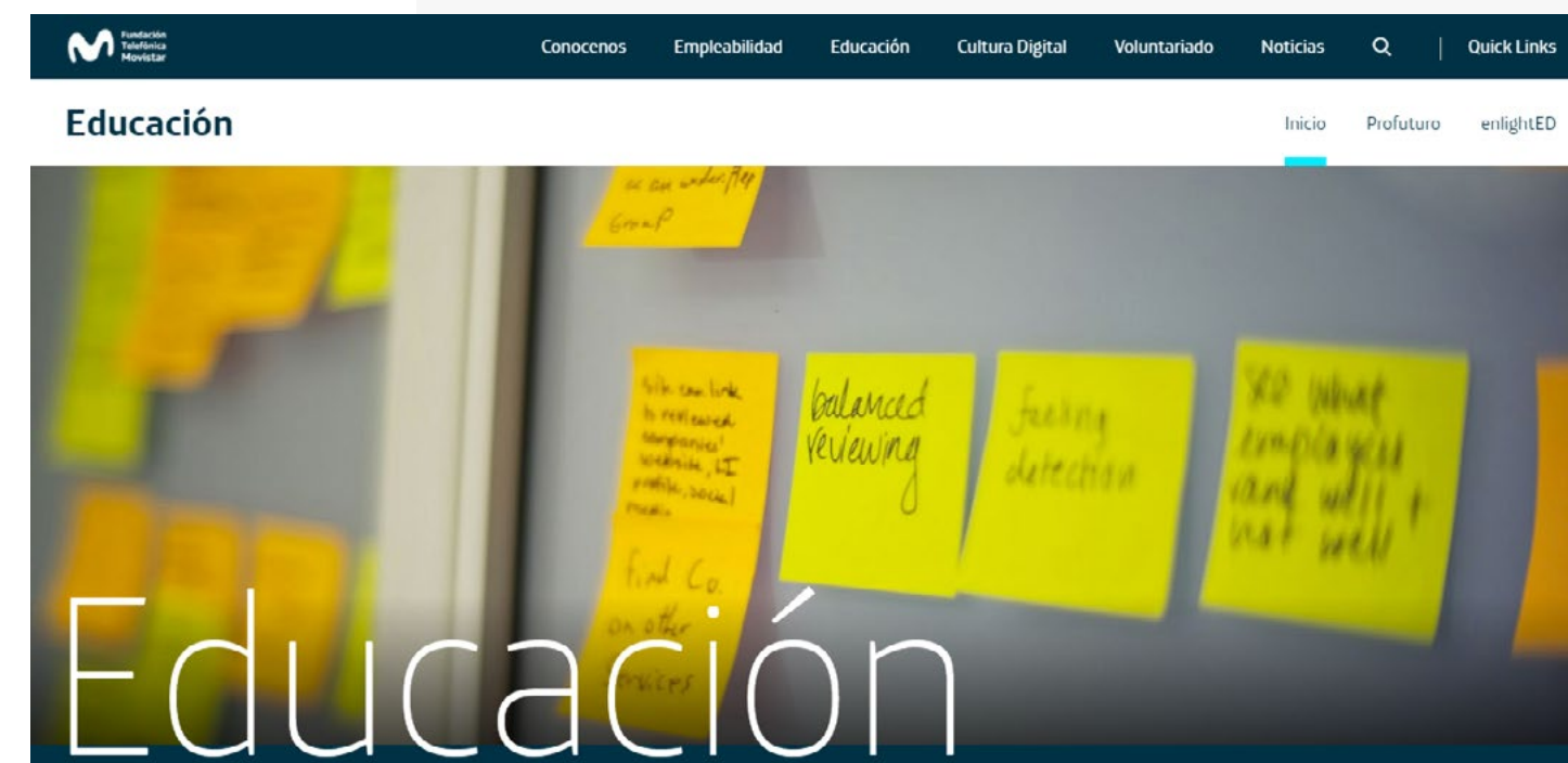
Programa de Educación